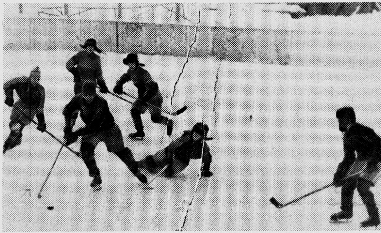
Острый момент.